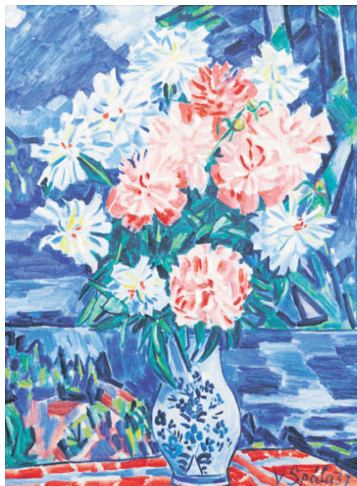
Václav Špála – Kytice pivoňek