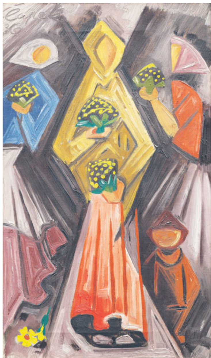
Josef Čapek – Ženy s květinami

Není nikterak výjimečné, že i obrazy známých autorů dosáhnou na aukčních rekordní ceny. Příkladem může být výjimečný obraz Jakuba Schikanedera