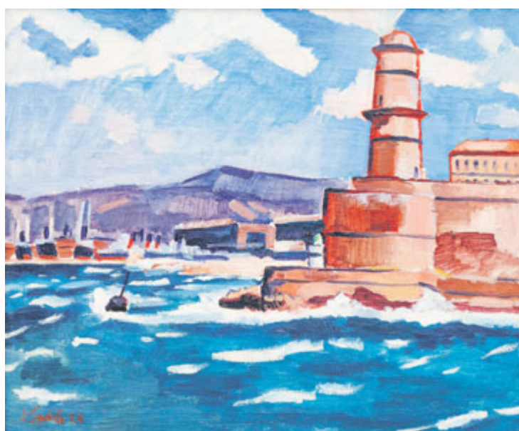
Václav Špála – Starý přístav v Marseille