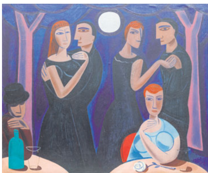
Karel Černý – Tanec v zahradě

Pokud máte doma obraz, kresbu nebo grafiku a chcete je výhodně prodat, nevyplatí se prodávat je v bazaru. Můžete je nabídnout do aukce. Výhodou tohoto prodeje je, že výsledná cena může dosáhnout vyšších hodnot než v případě komisiního prodeje, kdy je konečná cena předem stanovena. Nevíte, jak postupovat? V Galerii KODL vám poradí.